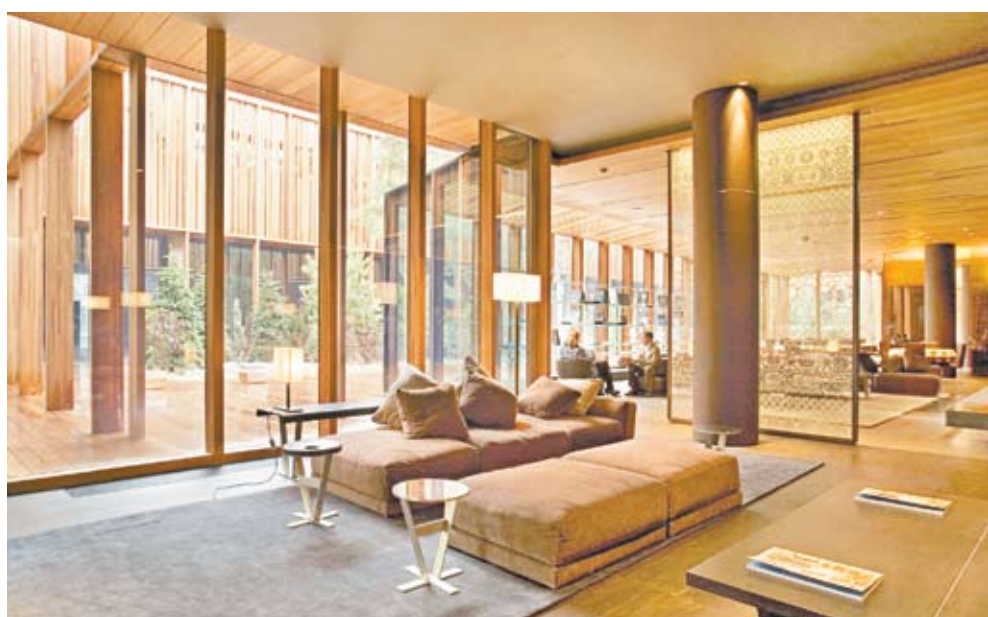
Холл гостиницы Barvikha Hotel & Spa