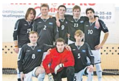
Футбольная команда КМТ. Москва, 2009 год