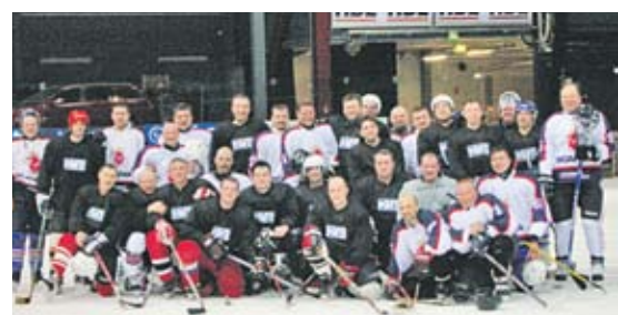
Хоккейная команда КМТ и Scania. Хельсинки, 2007 год