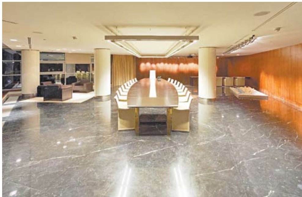
Офис компании «Дон-Строй». Конференц-зал