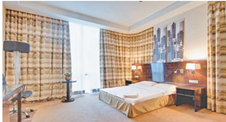
В номерах клубного корпуса будет эксклюзивный уровень комфорта и обслуживания