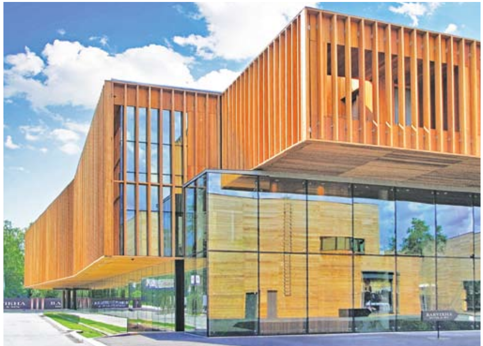
Barvikha Hotel & Spa