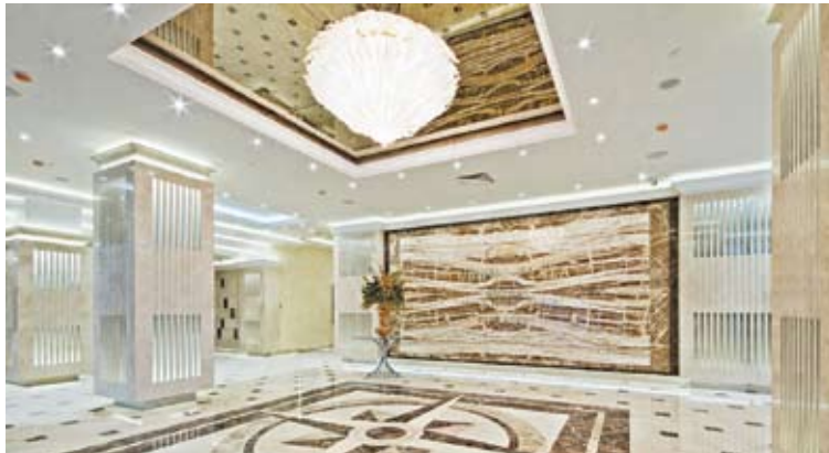
Холл отеля Crowne Plaza Moscow WTC